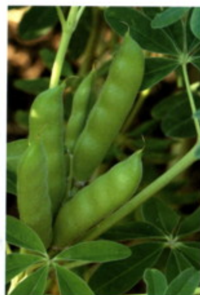
Lupinus albus L. - lupina bílá (vlčí bob bílý), lusk