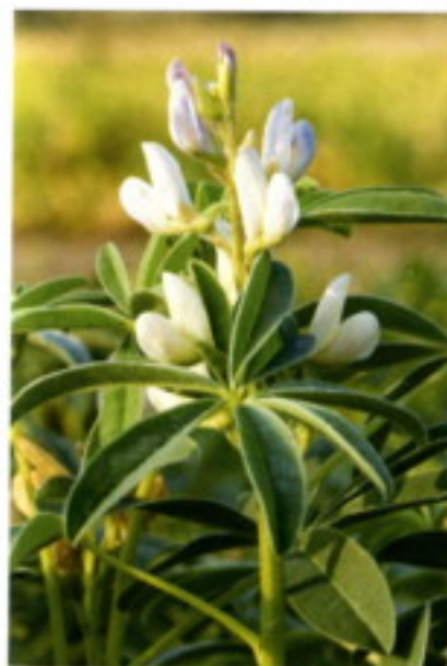
Lupinus albus L. - lupina bílá (vlčí bob bílý), květ

Lupinus albus L. - lupina bílá (vlčí bob bílý). Je to pravděpodobně nejdéle pěstovaný druh. Jednoletá, u nás nepůvodní, bylina s hlubokým větvicím se křovítkem kořenem. Bývala zřídka pěstována jako krmivo a k zelenému hnojení. Rostlina je nápadná svojí vzrůstností, dosahuje výšky 100 - 150 cm. Na vrcholu se lodyha větví. Květní hrozen je řídký, květy mají krátké stopky, jejich barva je bílá, často s modrým nebo růžovým odstínem. Namodralé zbarvení na vrcholu koruny je druhovým znakem. Je to druh převážně samoprašný. Lusky má přímé a nepukavé. Semena jsou větší než u lupiny žluté