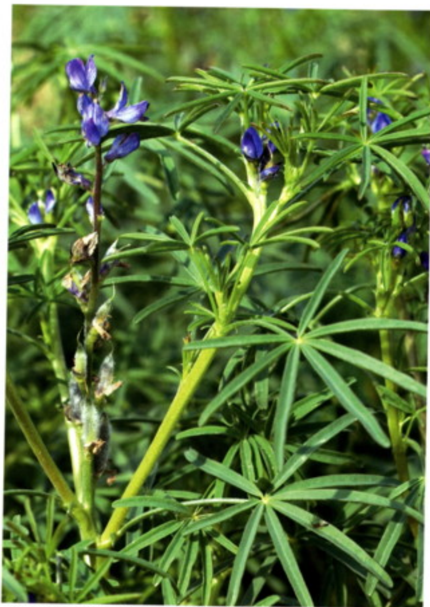
Lupinus angustifolius L. - lupina úzkolistá (vlčí bob úzkolistý), květ

druhu jsou vyšlechtěny sladké kultivary. Katalog OECD registruje 54 odrůd tohoto druhu, Společný katalog EU 39 odrůd. V České republice není registrována žádná domácí odrůda, jsou registrovány 3 zahraniční odrůdy (Boregine, Galant a Probor).